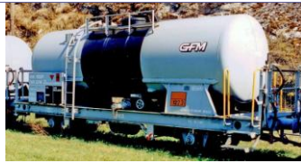
GFM Uhk - P 1102 Kesselwagen

2. Auflage in Arbeit, ausgebucht, Warteliste