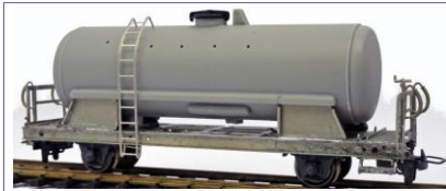
MOB X 29“ Wassertankwagen Baudienst

MOB – GFM – FO – BVZ – MGB Uhk – P Kesselwagen ( BTA – OKK ) . FRIHO H0m Handarbeits Modelle in gemischt Bauweise, Kessel ** Kunststoff, Unterteil etc. in Neusilber / Messing.