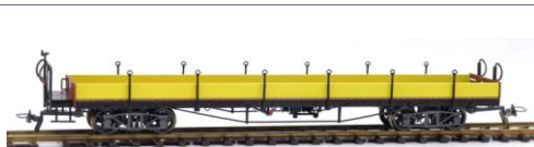
MOB Rko 827 ohne Ladung