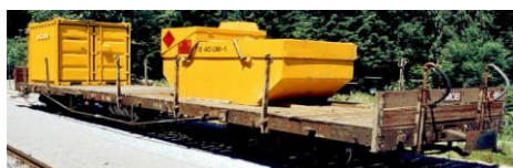
MOB X 46 Baudienst Rungenwagen, ex Rko