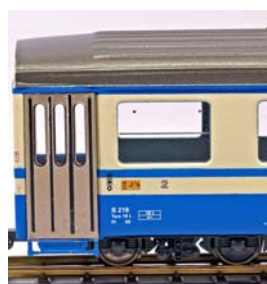
Ansicht Einstieg / Stirnseite (Vorserie)